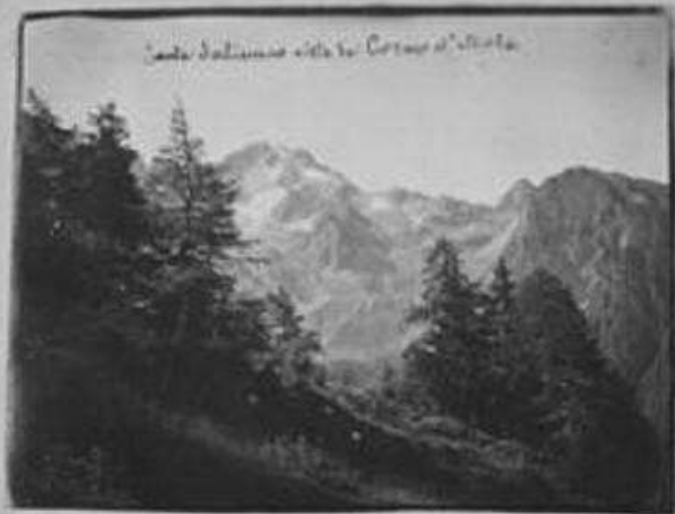
Costa Salinas alla fo. Corna d'Alpe