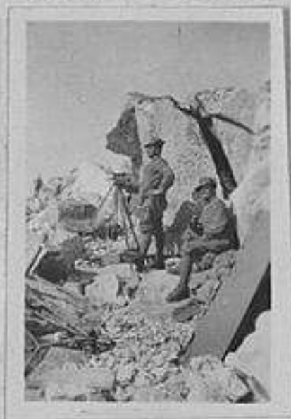
Stazione eliografica a Cima Lates