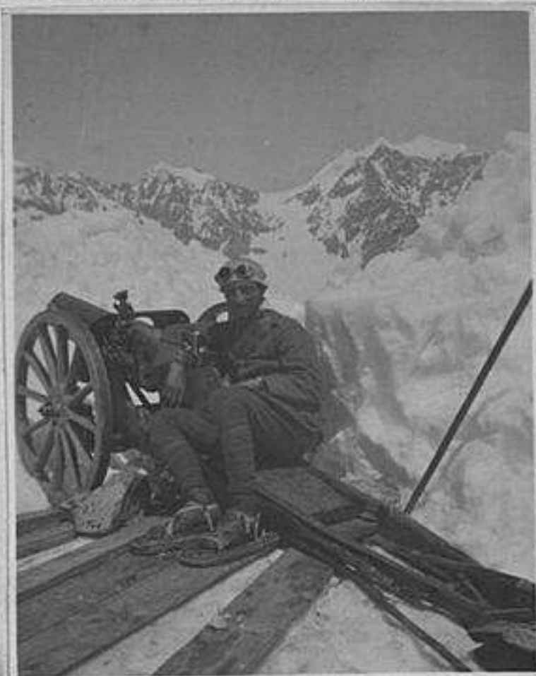
Sotto la Lobbia Basso