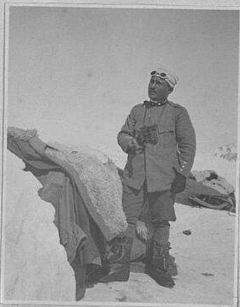
Al Passo della Lobbia Sembra l'orizzonte