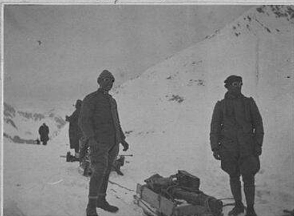
Materiale preparato per un traino