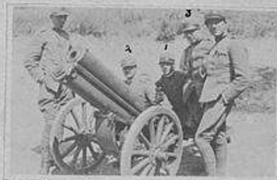
Un mortaro tolto agli austriaci