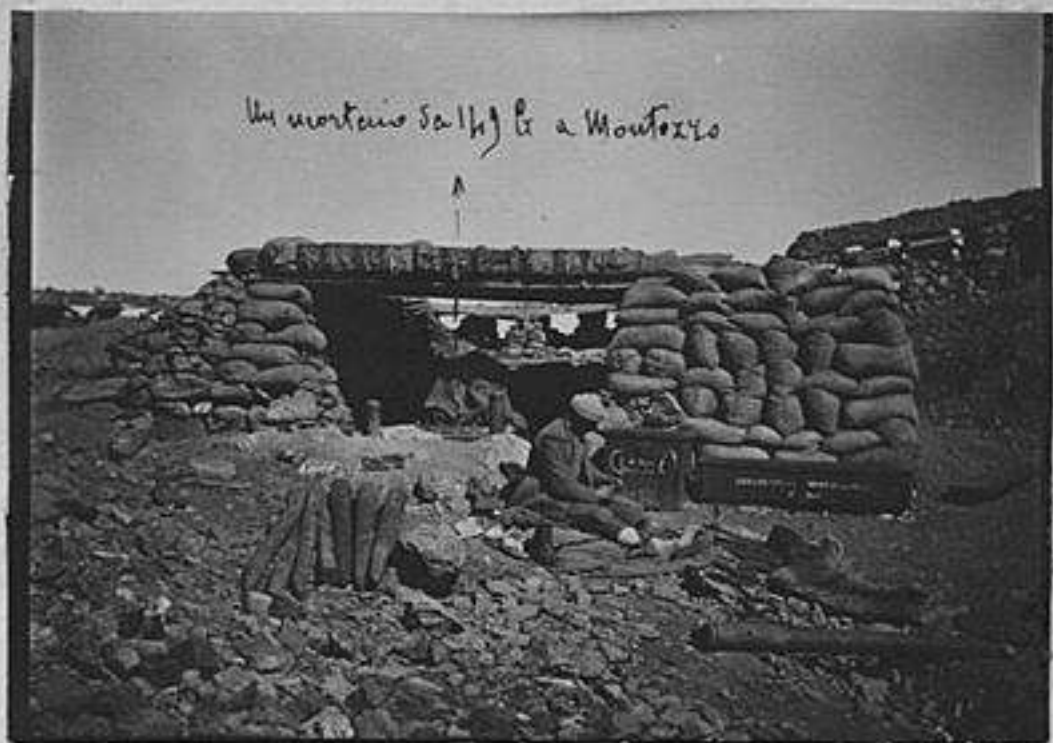
Un mortaro salito a Montorio