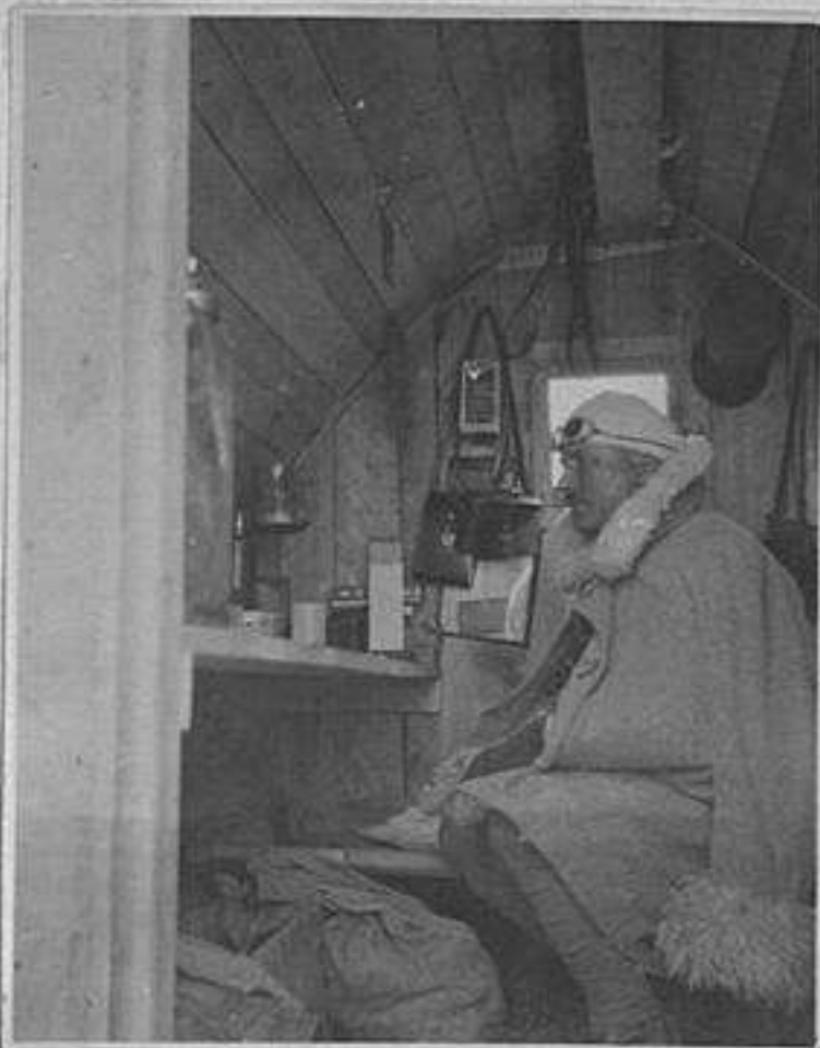
Il rifugio la sera, faticosa vigilia Kient