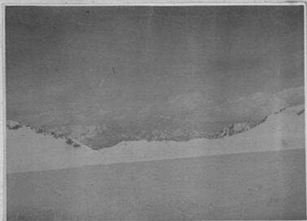
Valletta, sul Venero col