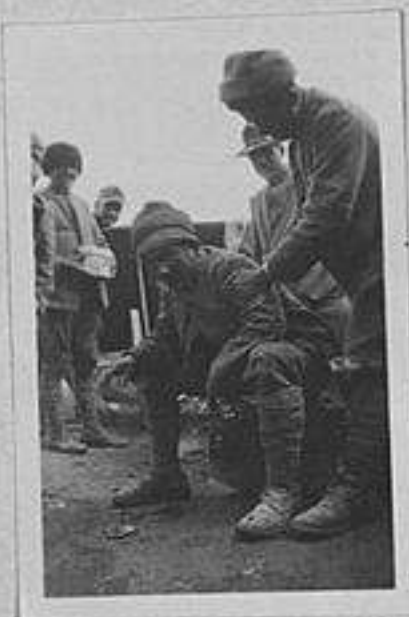
un ferito al posto