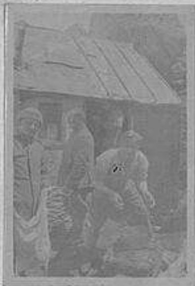
Da Cretta Croce - tiro di prova con una slitta freno