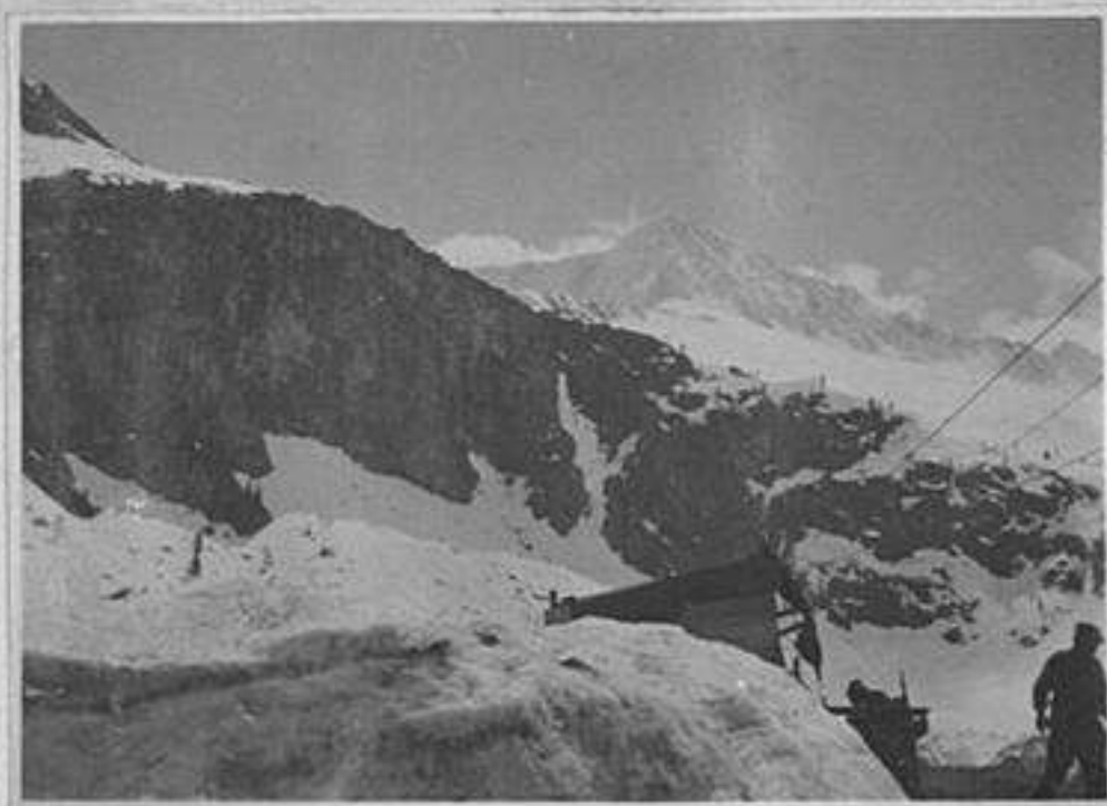
La stazione teleferica di Malga di Molto