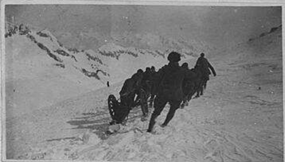
Esperimento di una slitta su neve