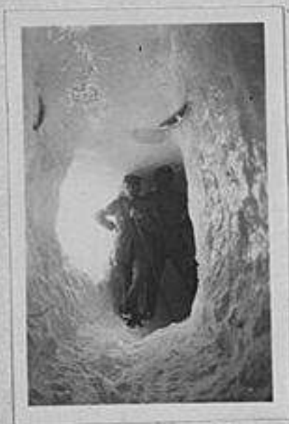
Galleria Patto S. Cavuto Patto S. Lared