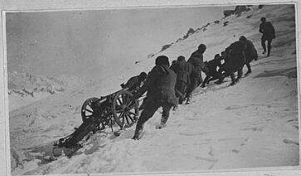
Esperimento di traino