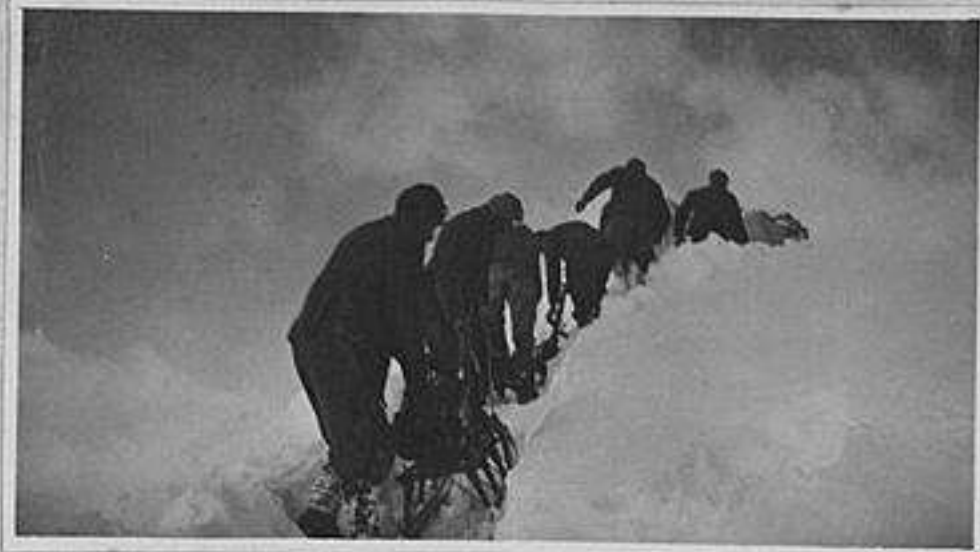
In trincea a Cetta Croce