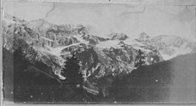
Il ghiacciaio del Pizgama