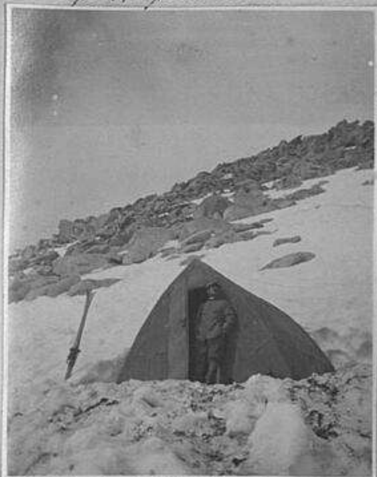
Sotto la Lobbia Alta - L'arrivo di un colpo a tempo molto alto