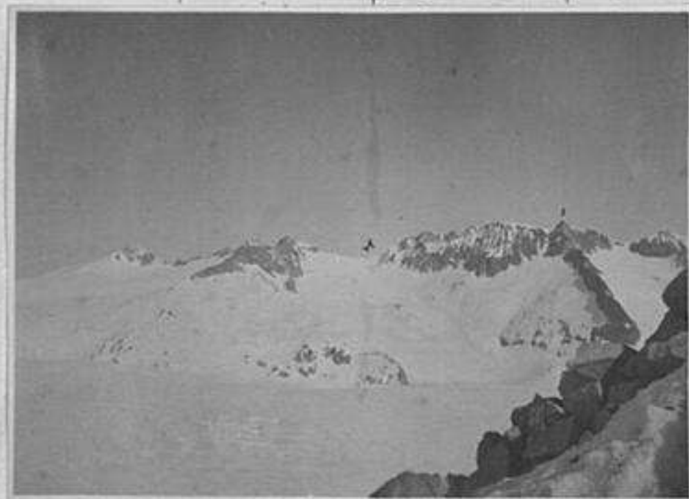
Corvo Bedole Bella Valletta O mo del Lago Punta Pisgana