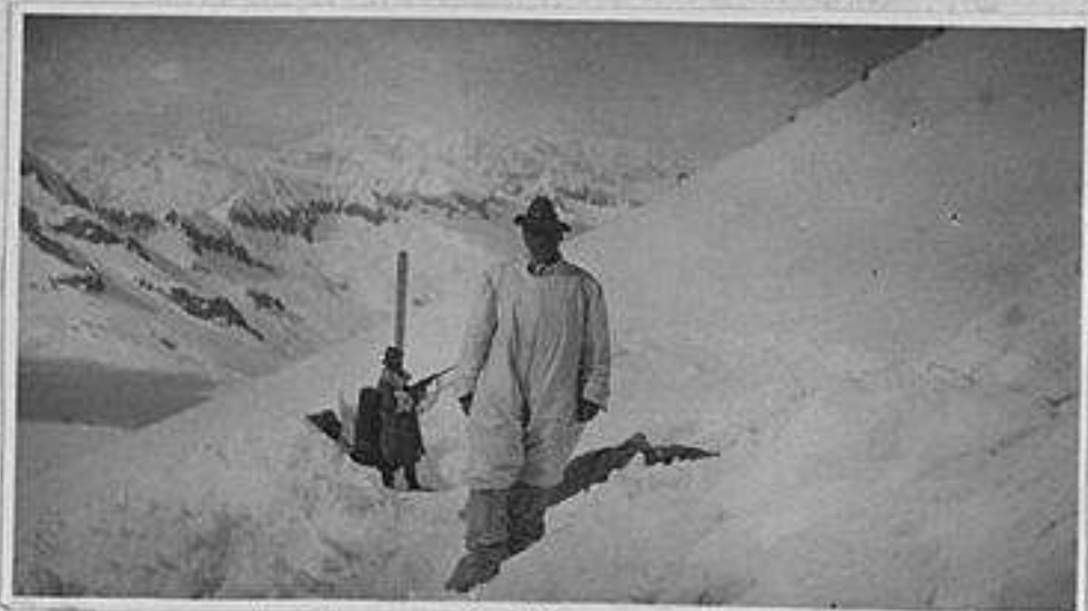
Dopo il combattimento del 30 aprile 1916