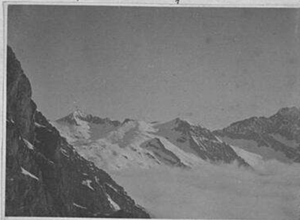
Vedretta del Pisgana Corvo Bedole Cima Bianchi