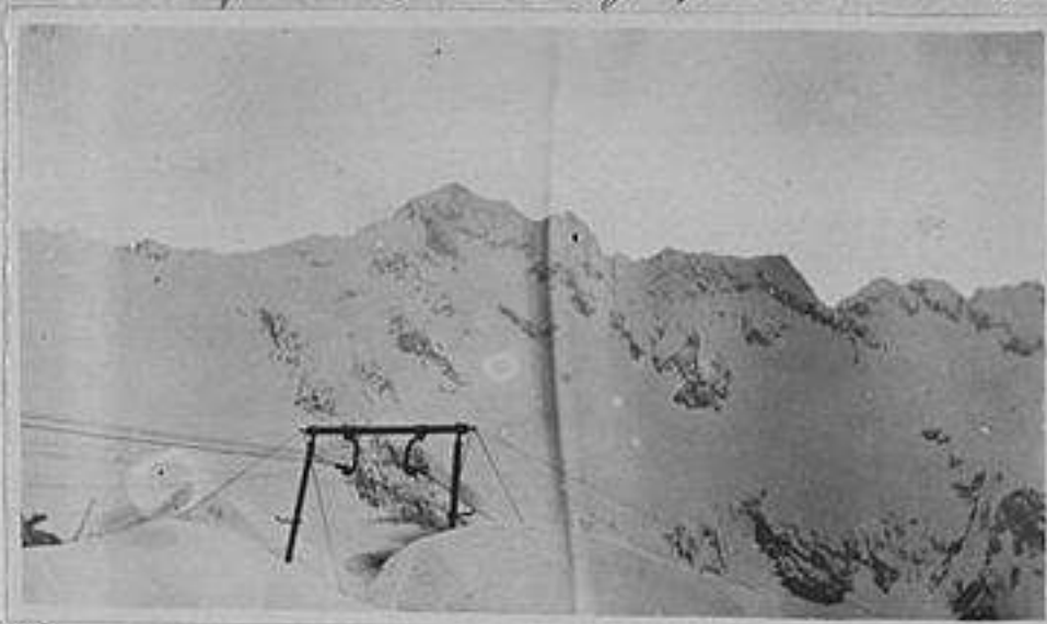
Salgo la teleferica Rifugio Faribalt - Passo Faribalt