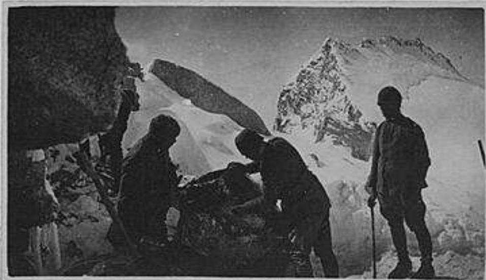
Durante i lavori della 4 a batteria a Cresta Croce