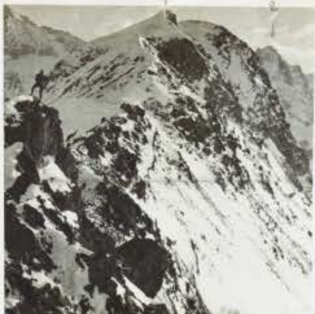
83 1) Cima Serodine 2) Il Castellaccio 3) I Monticelli ( austriaco )