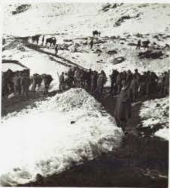
777 L'arrivo dei viveri al Serodine.