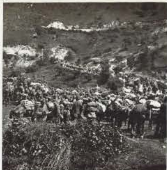
74 Balmarie lungo la strada del Tonale.