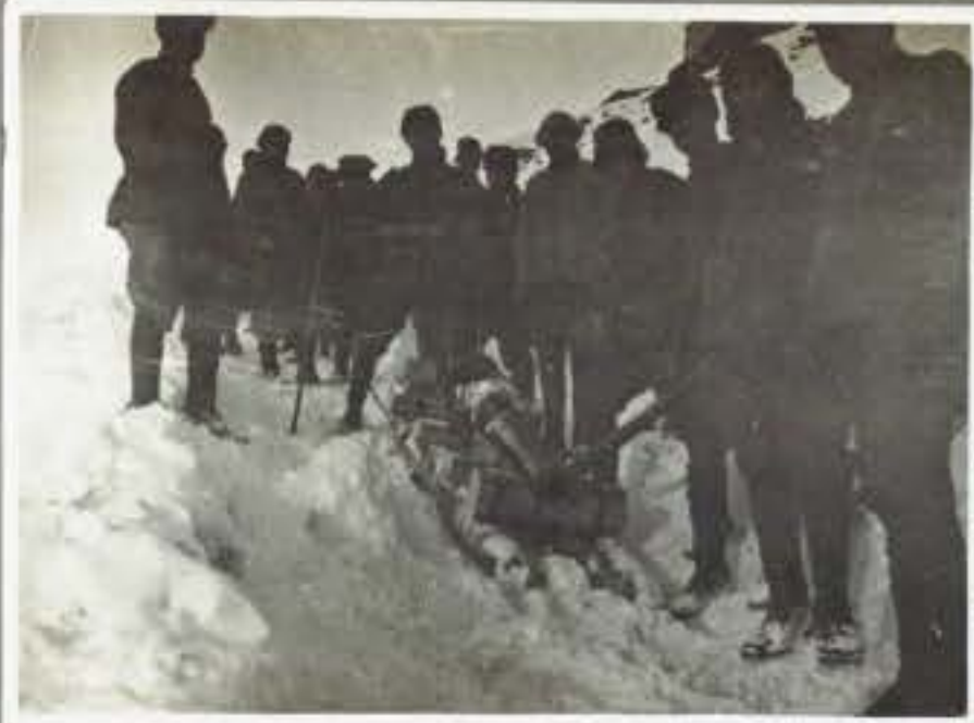
81 Fraine con elitta di un cannone da 87. da Ponte di Legno a Cima Sorti.