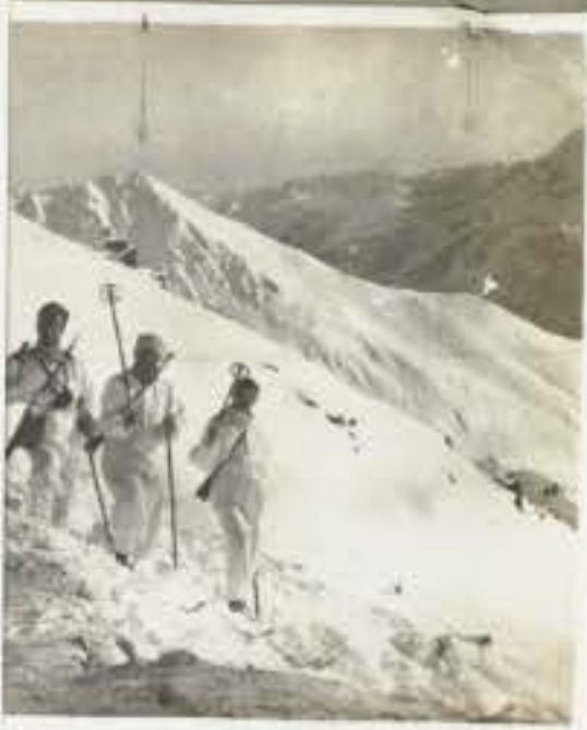
75 Skiatori in Valle Albiolo. 1) in fondo il Tonale sudtirolo 2) la valle del Sole