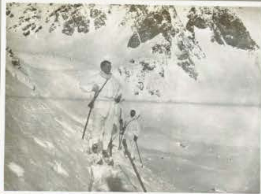
74 Skiatori in ricognizione in Valle Albiolo.