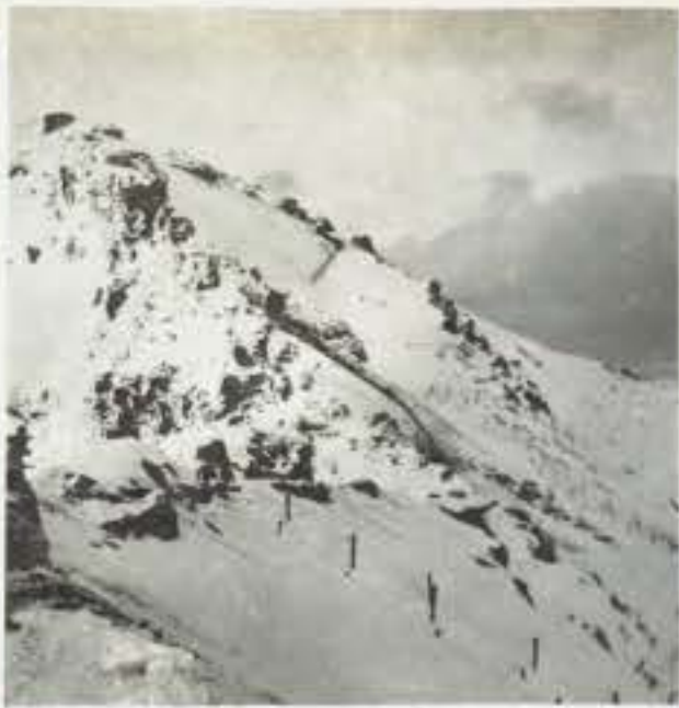
82 La piccola guardia a q. 2333 ( Tonale )