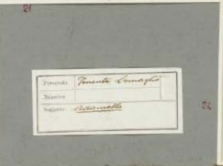
Photograph Tinente Comayla Negative Location Atacama