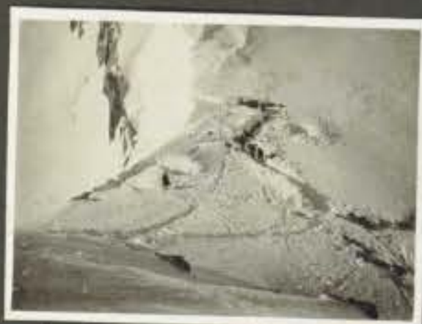
Negativo Descrizione Scoperta Casertana in montagna alla punta della Croce (m. 3296) la flora è molto alta e variata. Col. alpino italiano il 29/4-16