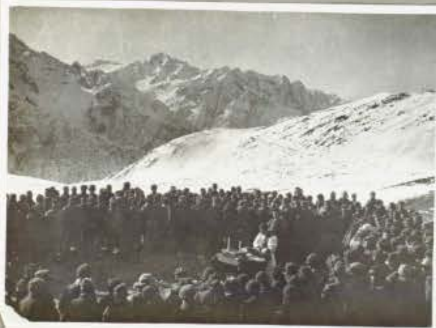
776 La messa di Natale al Serodine ( Tonale )