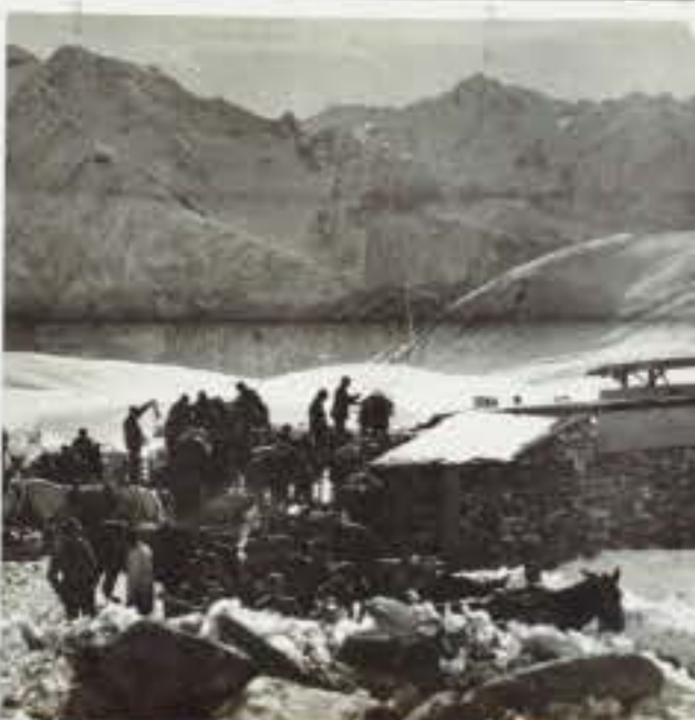
778 Arrivo di una colonna di rifornimento al Serodine. 1) il Piagnon 2) il Corno d'Aula 3) il Baitone