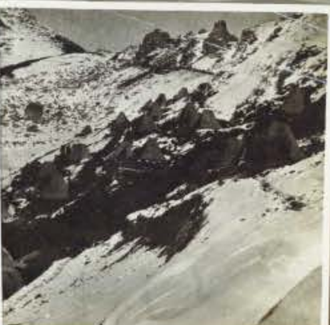
780 Sarcosamenti alla Bocchetta di Cima Sorti ( Tonale )