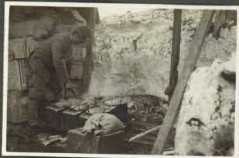
Negativo Descrizione Lavoro in alta montagna