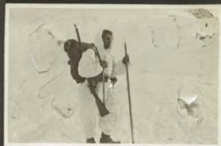
Negativo Descrizione Alpino in servizio di combattimento