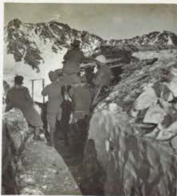
Trincee di Cima Gady ( Tonale ), in fondo il gruppo dell'Albiolo.