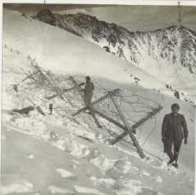
84 La costruzione di savalli di Frisia a q. 2735 sopra del Tonale. 1) Il Costone dell'Albiolo austriaco 2) Il Tonale Austriaco.