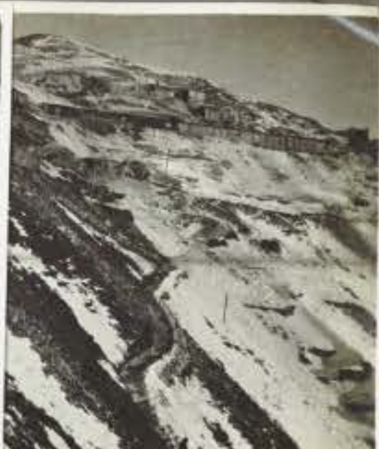
85 La gran guardia di Cima Cady; sopra del Tonale