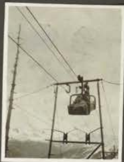
Fotografia Eno Bonaccorsi Negativo Descrizione Cable car in salita al passo Suro in 3149 (Alamelle)