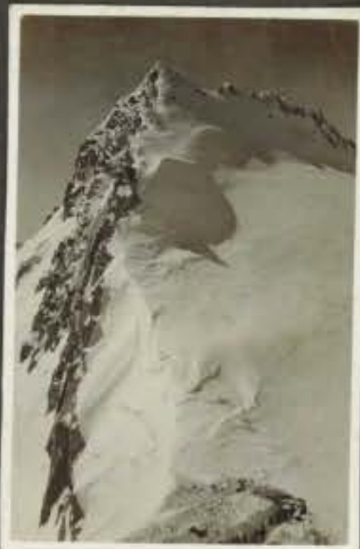
Negativo Descrizione Scoperta Casertana in montagna alla punta della Croce (m. 3296) la flora è molto alta e variata. Col. alpino italiano il 29/4-16