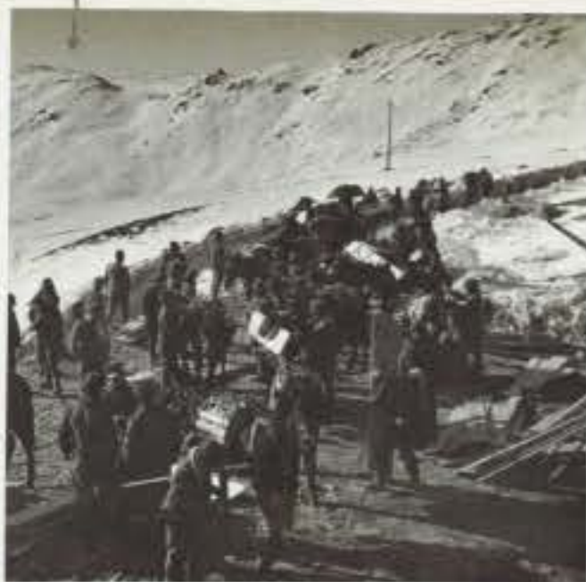
L'arrivo dei rifornimenti al Serodine. 1) il costone di Cima Sorti.