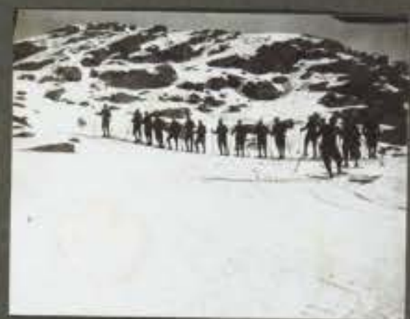
Fotografia Gen. Bonaccosta Negativo Soggetto: