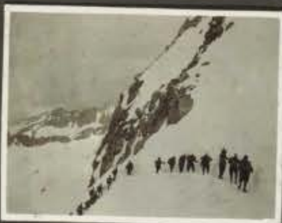
Negativo Descrizione Colonna nel passo dell'Alamelle