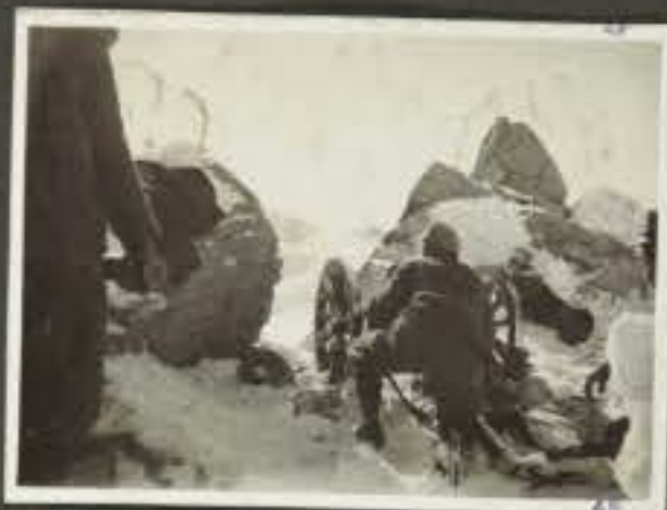
Negativo Descrizione Scoperta Casertana in montagna alla punta della Croce (m. 3296) la flora è molto alta e variata. Col. alpino italiano il 29/4-16