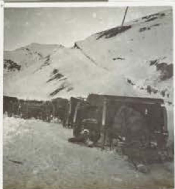
779 Colonna di artiglieria da campagna ( da 75 Deport )