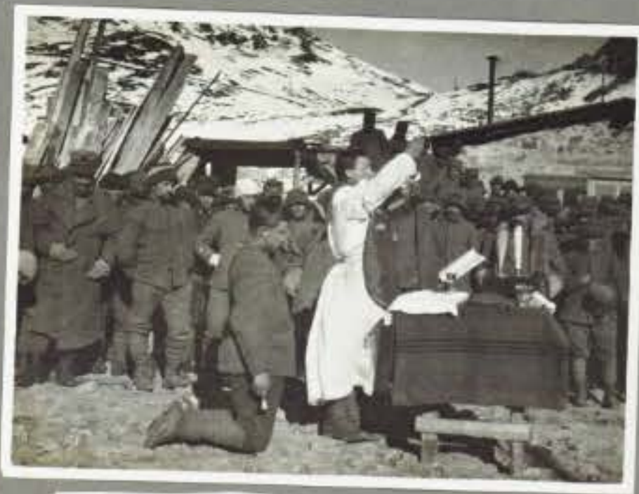
86 La messa di Natale al Serodine ( Tonale ).

Negative del Ten. ROCCA Pietro 27° Squadriglia aeroplani