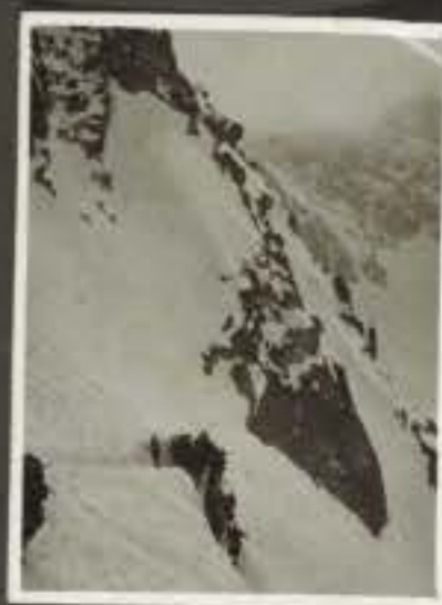
Negativo Descrizione Sotto al passo Brevia in Alamelle